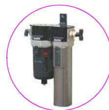
スーパードライヤユニット