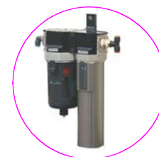
スーパードライヤユニット